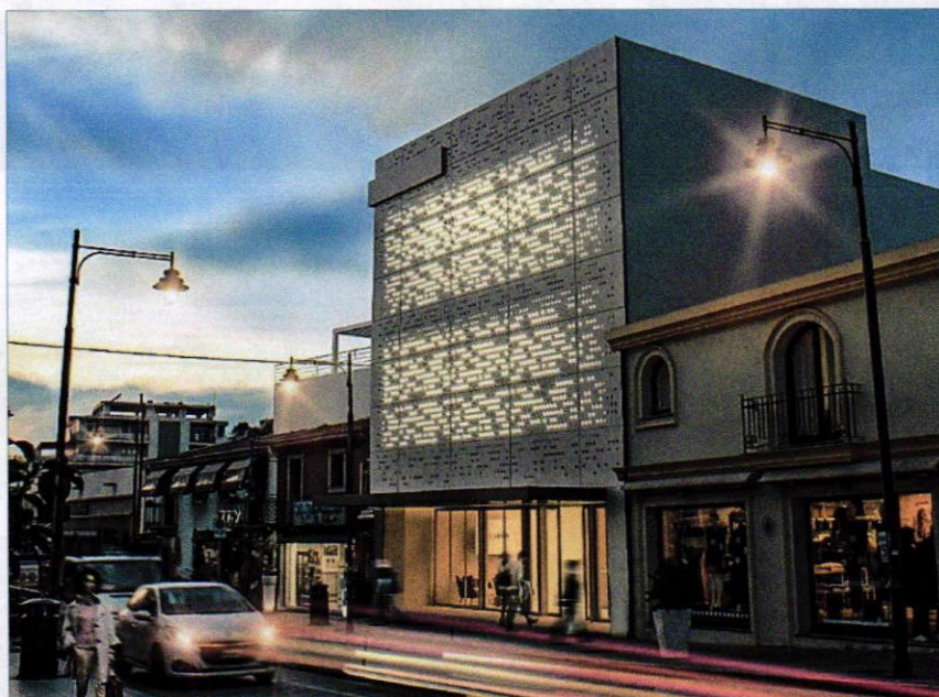
Centro Storico Olbia - Sede accademica centrale (in fase di realizzazione) "Polo UniOlbia"

Insieme di strategica valenza urbana nel centro storico cittadino nella disponibilità del Comune di Olbia sulla base della delibera Giunta Regionale 35/15 del 2020 sarà oggetto nei prossimi mesi di una importante riconversione-ristrutturazione funzionale che consentirà di disporre di superfici adeguate per aule didattiche e servizi pertinenti che andranno a sviluppare e qualificare ulteriormente l'offerta di spazi innovativamente attrezzati a misura di studente. L'edificio ha una dimensione di 2.500 mq.