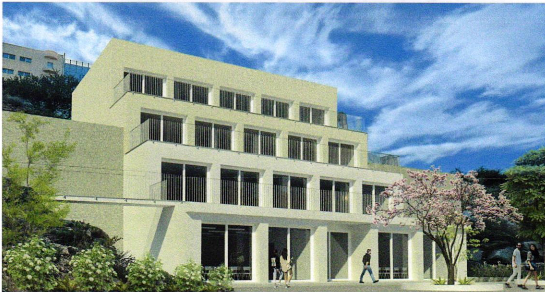
realizzazione di polo didattico universitario, Ospedale Mater Olbia