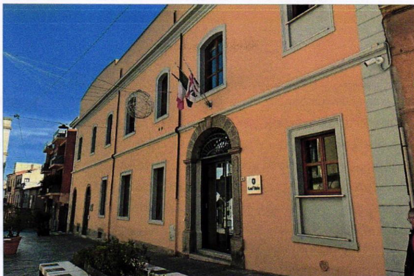
Centro Storico Olbia - Sede istituzionale "Polo UniOlbia"

Associazione costituita ai sensi degli artt. 14 e s.s. del Cod. Civ. e D.lgs. n. 117/2017 Iscritta al Registro Regionale persone giuridiche di diritto privato al n. 282/2020